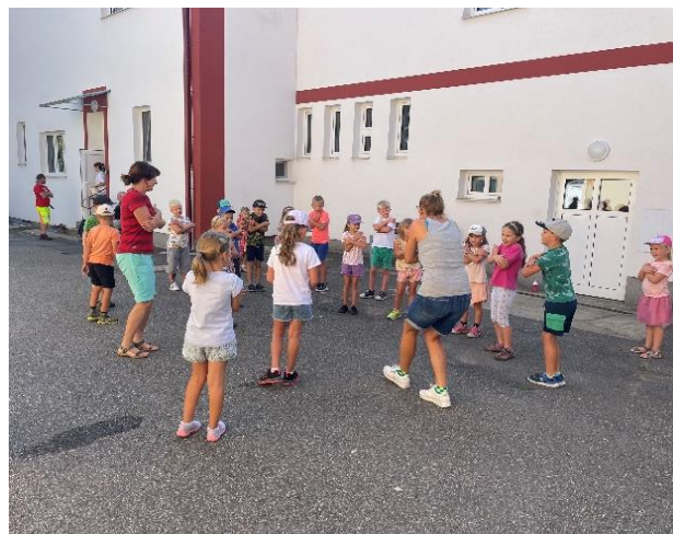
Společné cvičení na školním dvoře je legrace.

Kromě tradiční školní družiny a klubu jsme opět rozšířili nabídku školních kroužků, jejich činnost bude zahájena v polovině září.