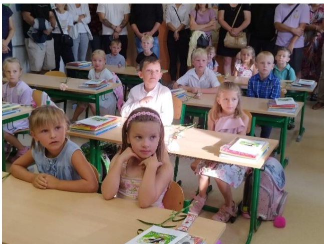
První den v lavicích trochu nesměle.

Od druhého týdne už jede výuka naplno. V základní škole máme opět dvě první třídy. Celkem 180 žáků. Ve školce je ve dvou třídách celkem 41 dětí. Pedagogický sbor i provozní zaměstnanci jsou už naši i vaši „staří známí“.