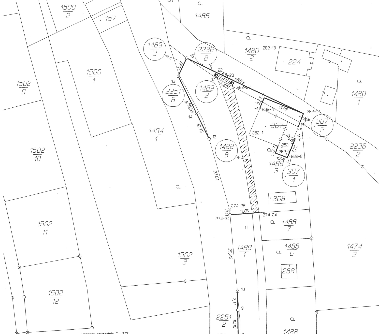
Seznam souřadnic S-JTSK